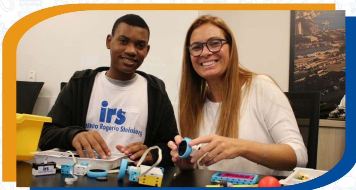
Evento de voluntariado reverso - Desafio de Robótica, com colaboradores da Empresa Wilson Sons

Assim, ao enquadrar o case nesta categoria, reforçamos que o diferencial do IRS vai para além de “estar presente nas redes sociais”, mas em utilizá-las de forma estratégica e engajada, com foco na transformação social e no fortalecimento da causa das AH/SD.